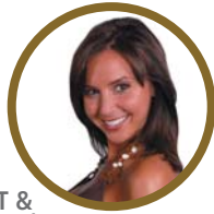
GESICHT & DEKOLLETÉ

BEAUTIFUL ■ HEALTHY ■ NATURAL ■ ANTI-AGING